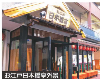
お江戸日本橋亭外景

コース番号 0138 10/4 (木) ●締切日：9/13 (水) 10:00～11:30 ●定員：15人