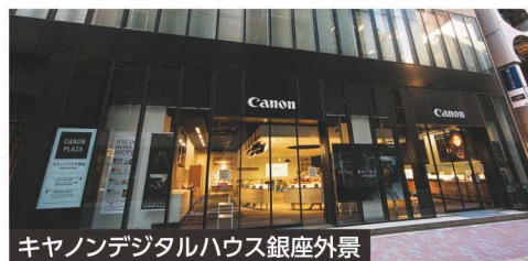
キヤノデジタルハウス銀座外景

コース番号 0139 11/13 (火) ●締切日：10/24 (水) 11:00～13:00 ●定員：10人