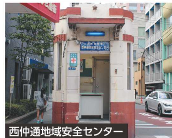
西仲通地域安全センター