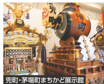
兜町・茅場町まちかど展示館