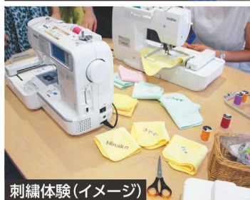
刺繍体験(イメージ)