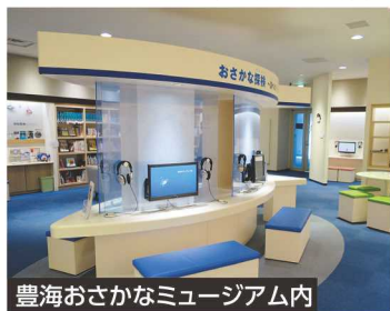
豊海おさかなミュージアム内

コース番号 0141 7/25(水) ●締切日:7/5(木) ●定員:15人 10:00~12:00