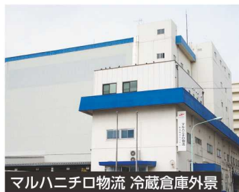
マルハニチロ物流 冷蔵倉庫外景