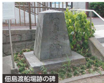
佃島渡船場跡の碑

コース番号 0114 7/29(日) 16:00~18:00 ●締切日:7/9(月) ●定員:15人