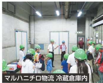
マルハニチロ物流 冷蔵倉庫内