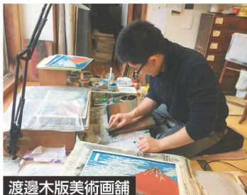
渡邊木版美術画舗

コース番号 0144 9/10(月) ●締切日：8/21(火) 10:00～12:00 ●定員：10人