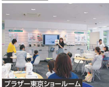
ブラザー東京ショールーム

コース番号 0140 8/10(金) ●締切日:7/22(日) ●定員:10人 10:00~12:00