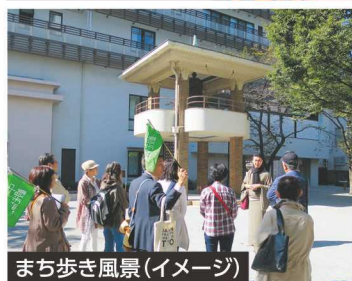
まち歩き風景 (イメージ)