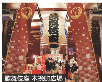
歌舞伎座 木挽町広場