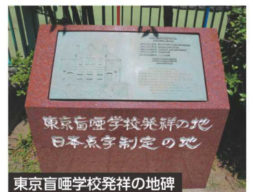
東京盲啞学校発祥の地碑

コース番号 0120 11/10(±) 13:30~15:30 ●締切日:10/18(水) ●定員:15人