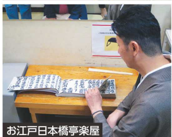
お江戸日本橋亭楽屋