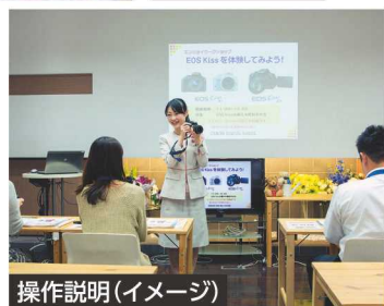
操作説明 (イメージ)