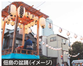
佃島の盆踊(イメージ)