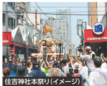
住吉神社本祭り(イメージ)