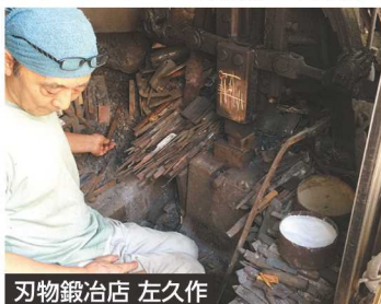
刃物鍛冶店 左久作

コース番号 0146 11/15(木) ●締切日：10/25(木) 10:00～12:00 ●定員：10人