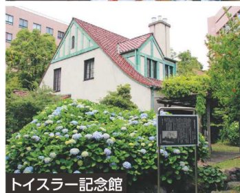
トイスラー記念館