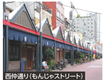
西仲通り(もんじゃストリート)