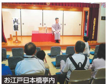
お江戸日本橋亭内