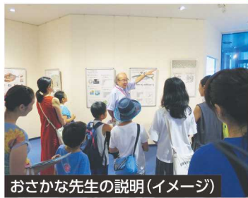
おさかな先生の説明(イメージ)