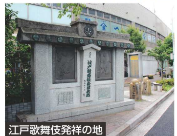
江戸歌舞伎発祥の地