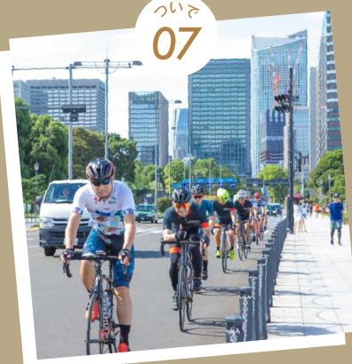
お客さんと一緒に旅するように繋がる ライダージャーニー