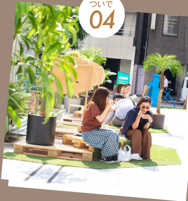
コーヒーがつかなく地域と世界 COFFEE PICNIC