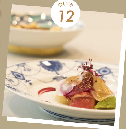
フレンチと和食器の共演 1日限りの美食倶楽部