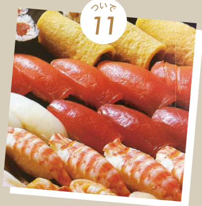
明治 12 年創業でトロ握り発祥のお店 吉野鮎本店