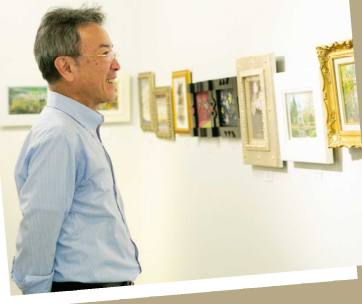
古美術店やギャラリーが多く点在 京橋美術骨董通り