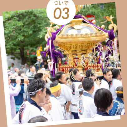
2年に一度、江戸っ子たちが待ちわびる祭礼 山王祭