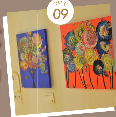
オフィスビルにアートをインストール Art in Tokyo YNK