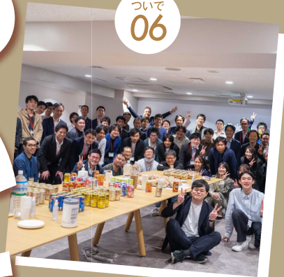
八重洲発スタートアップスタジオ xBridge-Tokyo