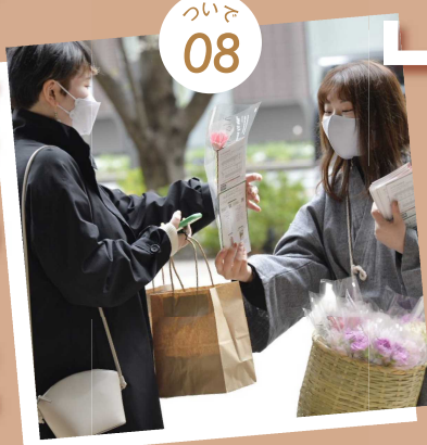
花と人と街に新たな彩りを Meet with Flowers