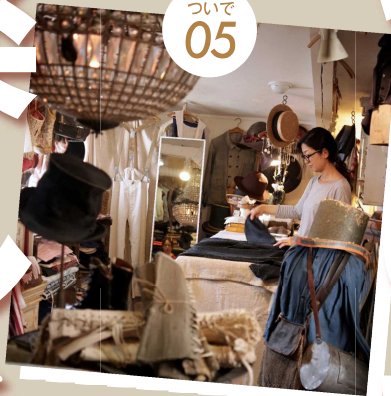
秘密の屋上古着店 Mindbenders&Classics