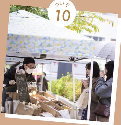
誰もが気軽に立ち寄れる地域の市場 京橋マルシェ