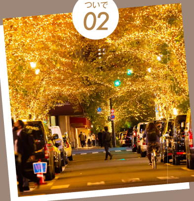
約 17 万球の「光の門」が連なる 東京イルミリア